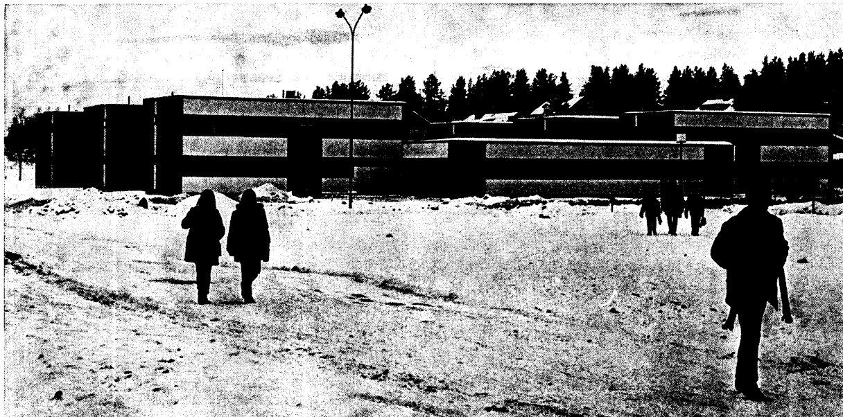
Samehögstadiets elevhem, Gällivare

På högstadiet är samiska ett kompletterande tillvalsämne som ersätter del av tillvalsämne eller obligatoriskt ämne som rektor bestämmer efter samråd med eleven.