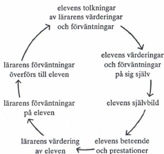
Figur 1. Lärares roll för elevens självbild och prestationer. (Taube 2007:93)

Som lärare är det viktigt att ställa lagom höga krav. Det får inte bli ett stort glapp mellan lärarens krav och elevens språkliga och kognitiva kapacitet. Karin Taube (2007:84) skriver att ett stort glapp kan leda till kognitiv förvirring, alltså att eleven inte förstår vad det han eller hon ska lära sig går ut på. Figur 1 visar hur viktig lärarens förväntning och feedback är för elevens självbild, beteende och prestationer.