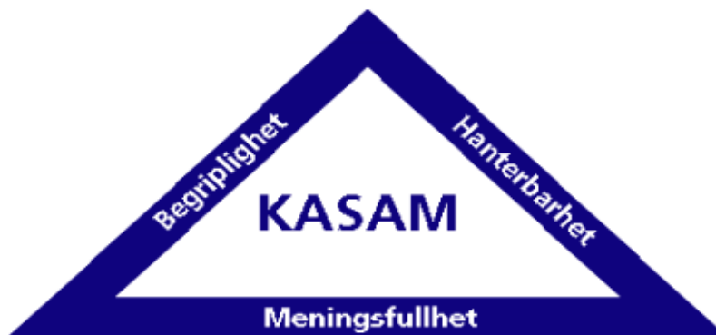
5.5.1 - Figur 3 – KASAMs tre delar

Detta i sin tur innebär att desto högre tillit på att det kommer att gå bra för mig, desto större chans är det både att det gör det, och desto bättre kommer din hälsa att vara. Detta kan tolkas in i bemötandet och i sin tur det stödet man ger barn med svenska som andra språk, för upplever de då att de själva har ett sammanhang så mår de bättre, vilket kan vara en utav de anledningarna till att barnen i min undersökning generellt sätt upplever sin skolgång som positiv när de numera utan stöd vistas i en ordinarie klass.