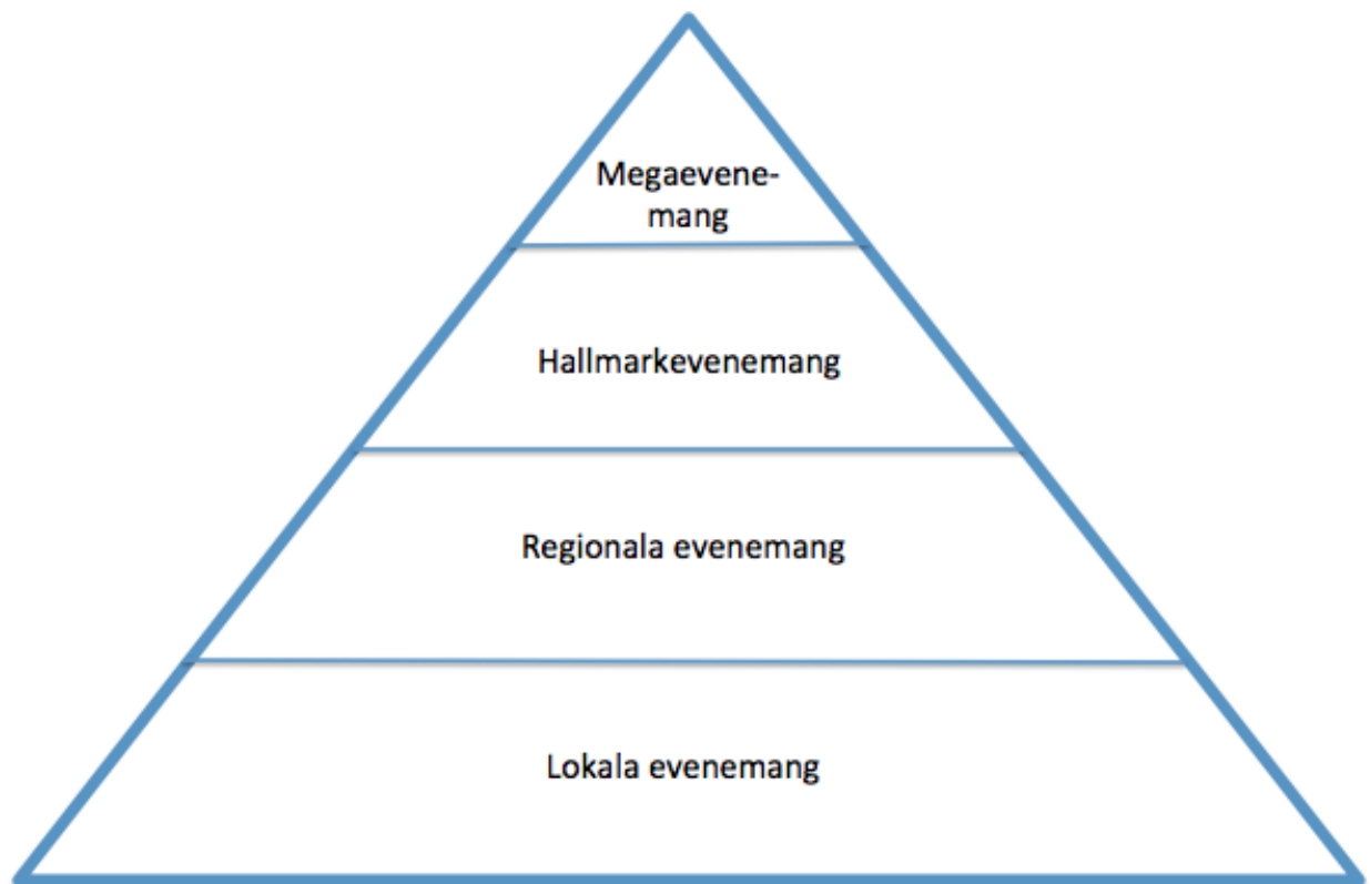
Figur 3. Evenemangsportföljen. Källa: Getz (1997).

En underliggande nyckelfaktor till hållbarheten som central aspekt är att nästan alla evenemang i modellen har ett turist- och samhällsvärde. Dock är endast ett fåtal kapabla till att generera en större turistefterfrågan. Detta fåtal evenemang har dock andra värden som i sin tur kan inneha potentialen att bli hållbara turistattraktioner. Målet med evenemangsportföljen hos de flesta destinationer är att fylla upp hela modellen för att evenemangsmixen skall erbjuda en variation av evenemang. (Getz, 1997)