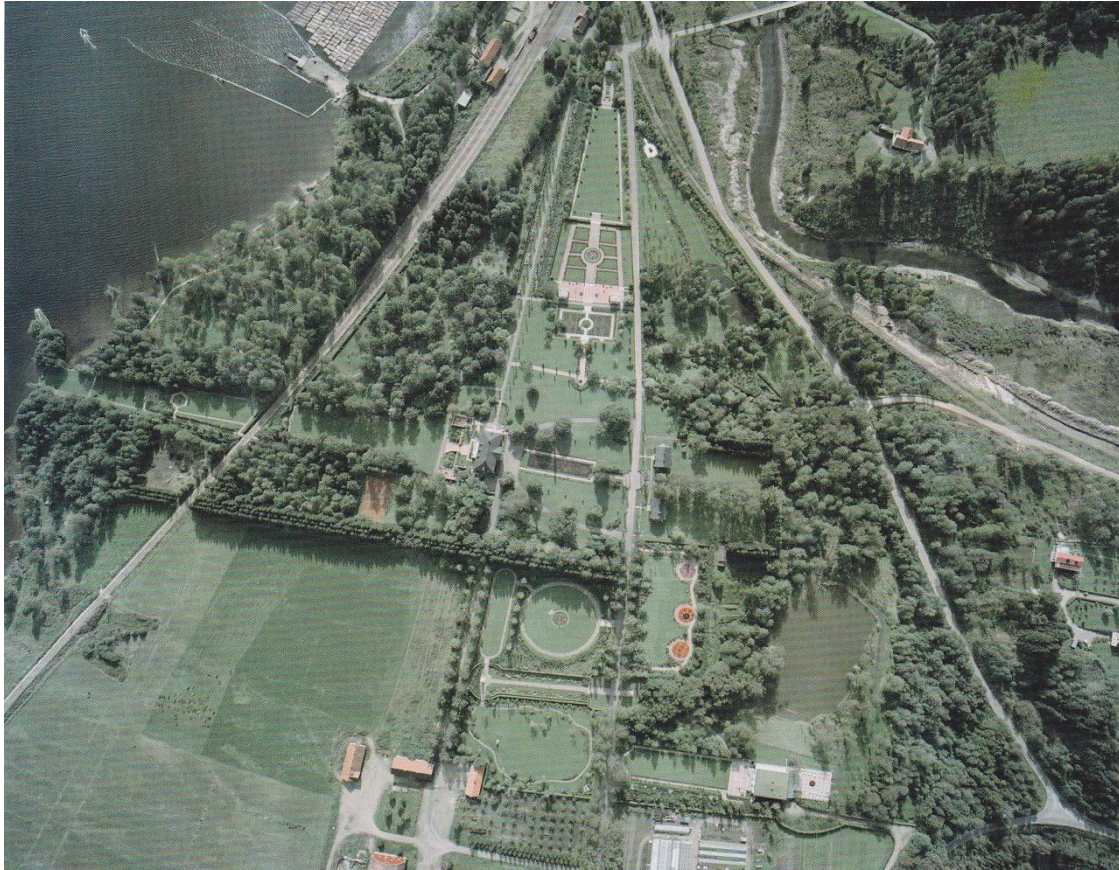
Flygbild av Rottneros Park från 1961. (Ur Drömmen om Rottneros Park, 2011 s. 22)

Rottneros Park är en stor anläggning. Det tar tid att förflytta sig i parken, transportsträckorna är långa och ofta är det ofta svårt att ta sig fram på grund av många besökare. Av hänsyn till besökarna sker gräsklippning och bevattning tidiga morgnar innan parken öppnar. Samtidigt krävs hänsyn till de privatpersoner som bor i herrgården och flyglarna. Användandet av maskiner kan inte ske hur tidigt som helst. Marken som parken är anlagd på består huvudsakligen av tung lerjord. Genom förskjutningar i marken har murar, gångar och terrasser börjat röra på sig vilket medför ett tungt underhållsarbete. Marken är också dåligt dränerad vilket speciellt ställer till problem för växtligheten i parkens lägre regioner, till exempel arboretumet som ligger i parkens sydöstra hörn. Bevattningsanläggningen anlades i början på 1970-talet och har vattenslangar liknande gamla brandslangar. En person klarar knappt inte att hantera och flytta dessa själv, det är både tungt och tar tid. Här finns dock en fördel med lerjorden, den behöver inte vattnas så ofta. Idéträdgårdsområdet, som är senast anlagt har dock fått en helt ny bevattningsanläggning. Ytterligare tidsödande problem är den eviga kampen mot rotgräsen kirskaål och revsmörblomma.