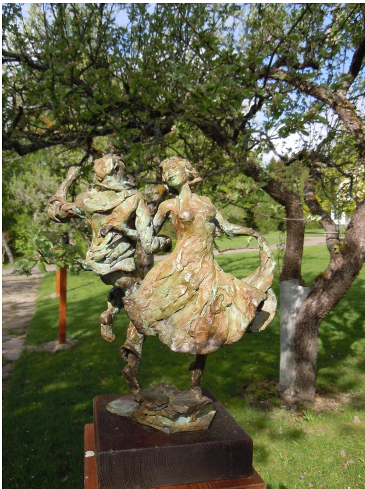
En skulptur i sommarens utställning.

En av de mest kända personerna med egen idéträdgård är Sven-Göran "Svennis" Eriksson. Han har sin fasta boplats i Sunne kommun och ställer gärna upp som reklampelare. Det räcker dock inte att locka besökare med enbart parken som upplevelsemål utan det krävs evenemang av olika slag. De senaste två åren har Idéträdgårdsområdet invigts med en tvådagars trädgårdsfestival i slutet av juni. I år är festivalen flyttad till första helgen i juli. I festivalen deltar bland annat företag med försäljning av trädgårdsprodukter, kända trädgårdsprofiler och artister. Övriga verksamheter som återkommer varje år är bilutställningar, hundutställningar och konserter för att nämna de vanligaste. Från och med 2010 bjuds nutida skulptörer in för att visa sina verk ute i parken över en sommar, några av verken köper parken in för utökning av den permanenta skulptursamlingen (Informant 1).