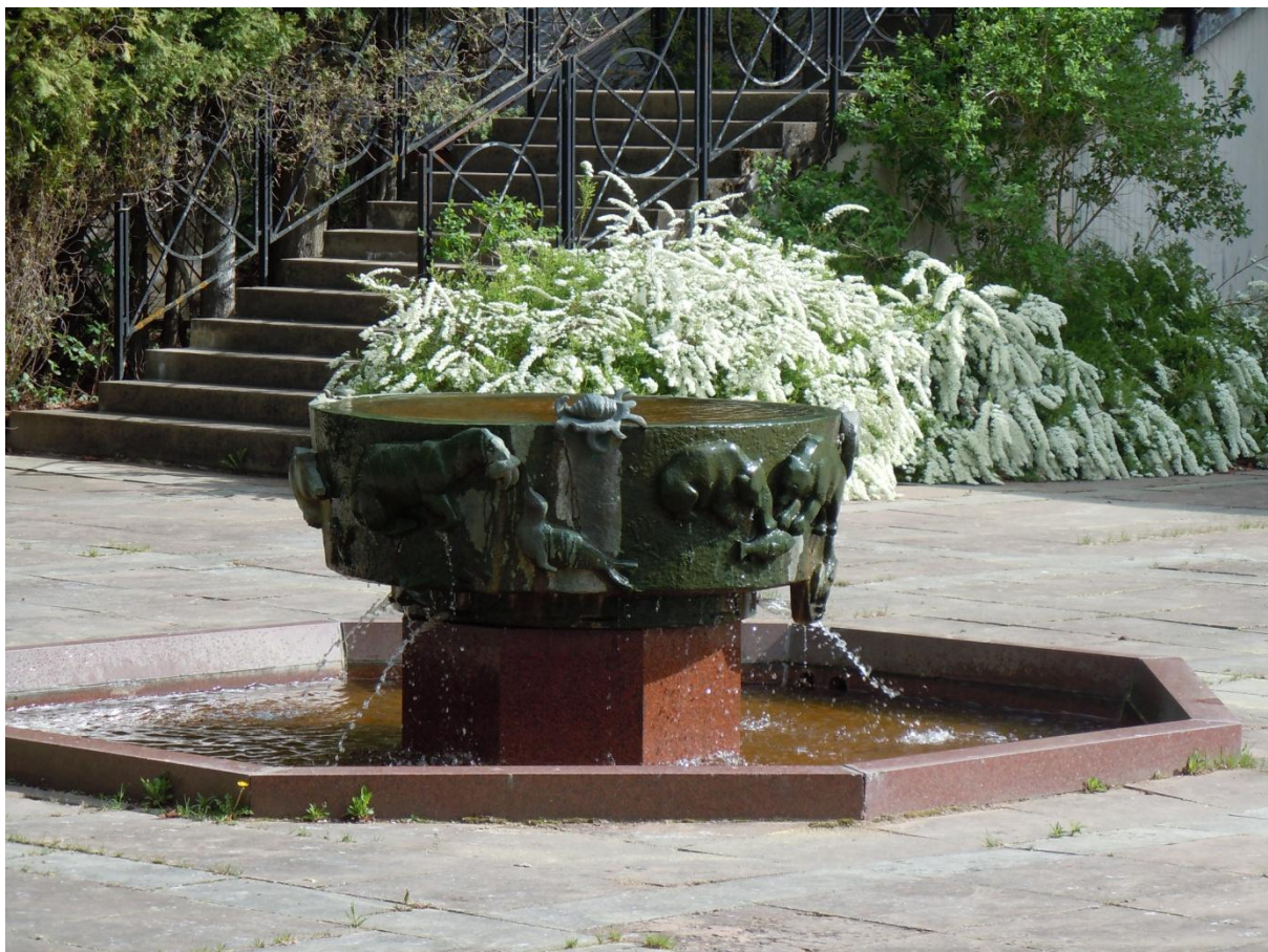
Fontän på Grateplatsen nedanför Rottneros Hallen.

En lönsam verksamhet för driftsbolaget är uthyrning av Spegelsalen som nästan varje helg är bokad för bröllop och andra större festligheter. Den vackra Spegelsaler ligger i en byggnad kallad Rottneroshallen och rymmer ca 200 middagsgäster. Lokalen har golv av marmor, väggar klädda med speglar och stora kristallkronor i taket. Dessa verksamheter till trots räcker inte för att parkens verksamhet ska vara lönsam. Driftsbolaget kämpar varje år med sin ekonomi och kommunala medel måste varje år till för att stötta verksamheten (Informant 1).