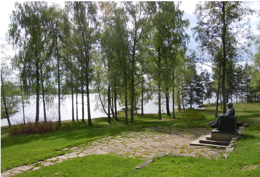
Del av Strandparken med Selma Lagerlöf som blickar ut över sjön Fryken