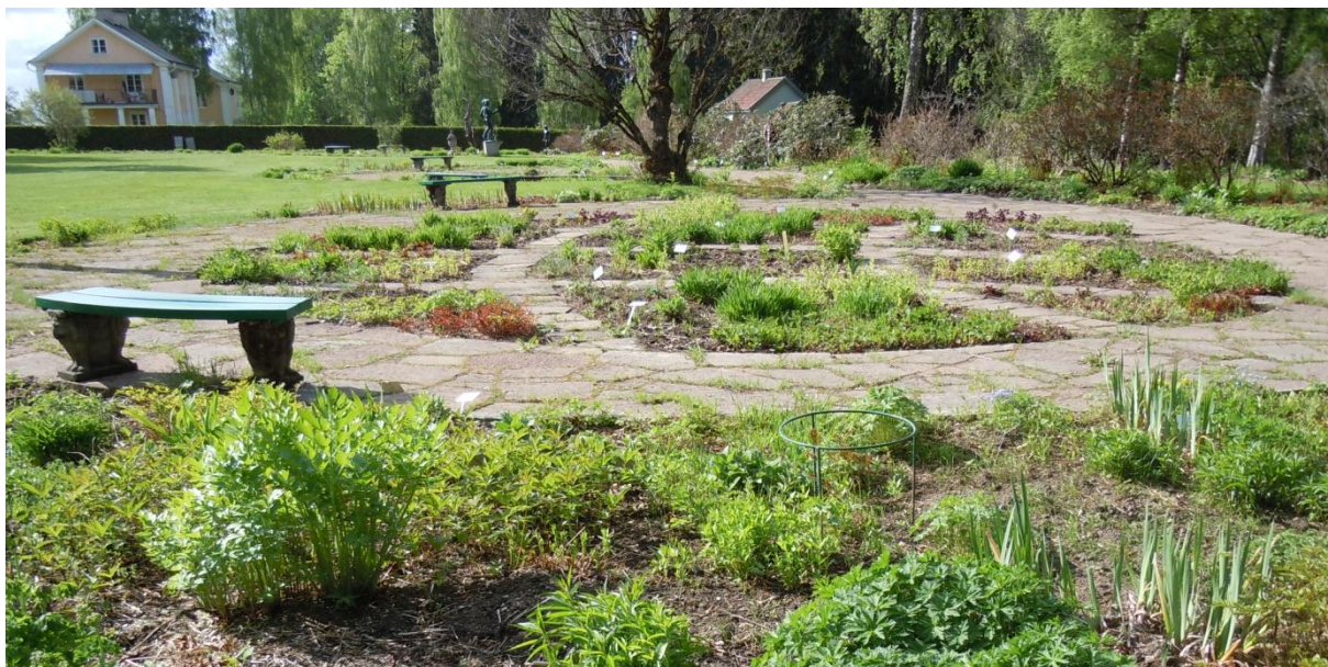
Del av Blomstergården

kantskärs minst en gång under sommaren. Det tunga arbetet sommartid består mest i att hålla alla utplanteringsväxter vid liv genom bevattning. För att sommarblommorna ska behålla sitt skönhetsvärde, gäller även perennerna, krävs kontinuerlig ogräsrensning och putsning. Vid tidsbrist prioriteras bevattning av främst sommarblommor och nyplanterade växter samt gräsklippning och trimning. Även ogräsrensning och putsning av blommor och skötsel av grusgångar prioriteras. Utöver ordinarie parkarbete ingår städning av personalutrymmen och offentliga toaletter, tömning av parkens alla papperskorgar och soptunnor inklusive hantering av sopor för återvinning. Om alla ligger bra till tidsmässigt i sitt arbete kan några dagars semester vara möjligt för personalen. Dock inte samtidigt.