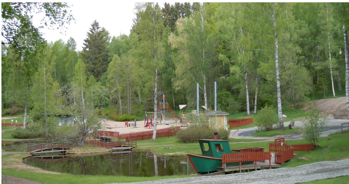
Del av Nils Holgersson Äventyrspark.