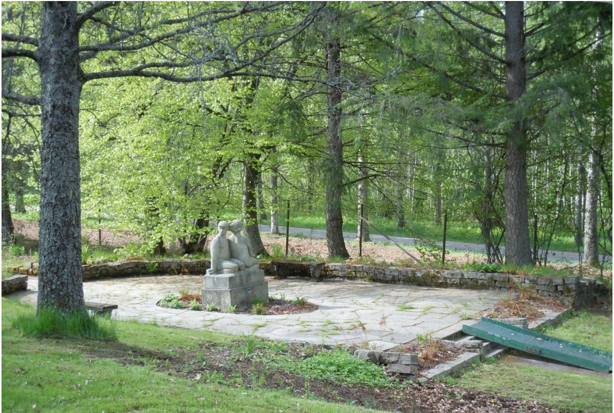
Vigelandsparken med skulpturen "Skremt", ett av Rottneros Park få original.

och en öst-västlig axel. De nord-sydliga axlarna konvergerar genom parken för att sammanstråla i en punkt i parkens sydliga ände Ytterområdena är mer naturromantiska i engelsk landskapsparkstil. (Johansson 2010, s. 17).