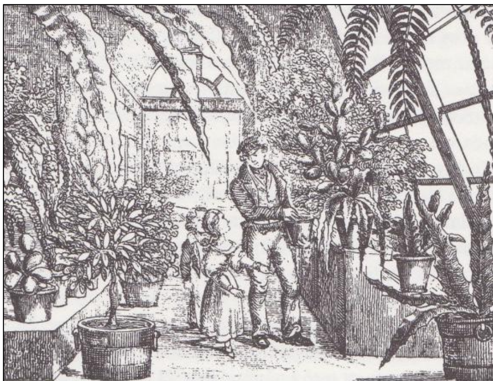
Trädgårdsmästaren i ett orangeri. (Ur Trädgårdspraxis 1754, 2002 s. 81)