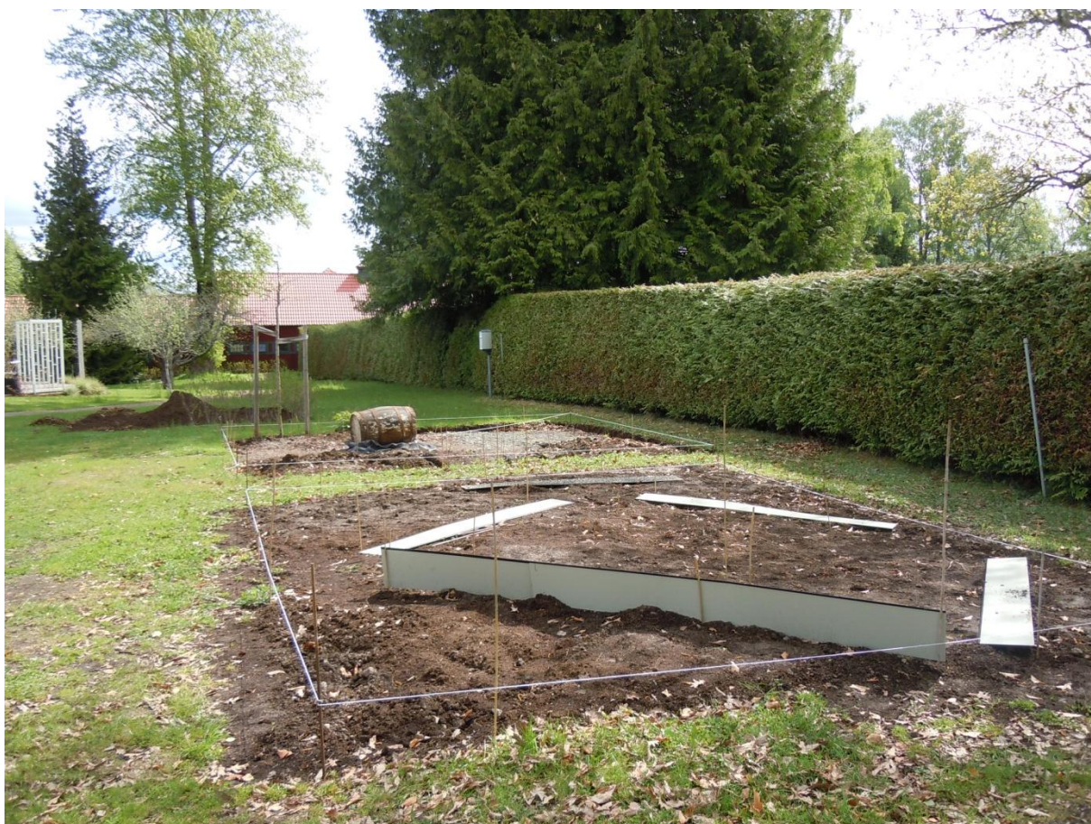
Idéträdgårdar under anläggning.

natur- och ytterområden samt städning och lövupptagning på gräsmattor och gångar. I mån av tid utförs beskärning av fruktträd annars är det beskärning av rabatt- och buskrosor som man lägger mer tid på. Därefter klipps alla perenner ner, man handgräver, med spade eller grep, alla ytor som ska planteras med sommarblommor och komposter bryts eller läggs om. Statyer som tagits in för vinterförvaring flyttas ut till sina platser, likaså papperskorgar, soptunnor och parkbänkar. El- och vattensystem för pumpar, bevattning och fontäner testas och startas upp. Därtill kommer anläggning av säsongens nya idéträdgårdar och att rätta till den grusade ytan för buss- och bilparkering samt besiktning av all lekutrustning. Senare på våren färdigställs och planteras nya eller restaurerade ytor med träd, buskar och/eller perenner. Därefter kommer utplanteringen av sommarblommor i urnor, rabatter, örtagård och idéträdgårdar. En viss del av dessa har förkultiverats eftersom vissa sorter inte går att få tag på hos odlare. Parken öppnar för besökare omkring 20 maj varje år.