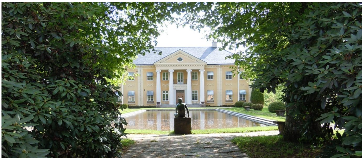
Herrgården med Spegeldammen idag.