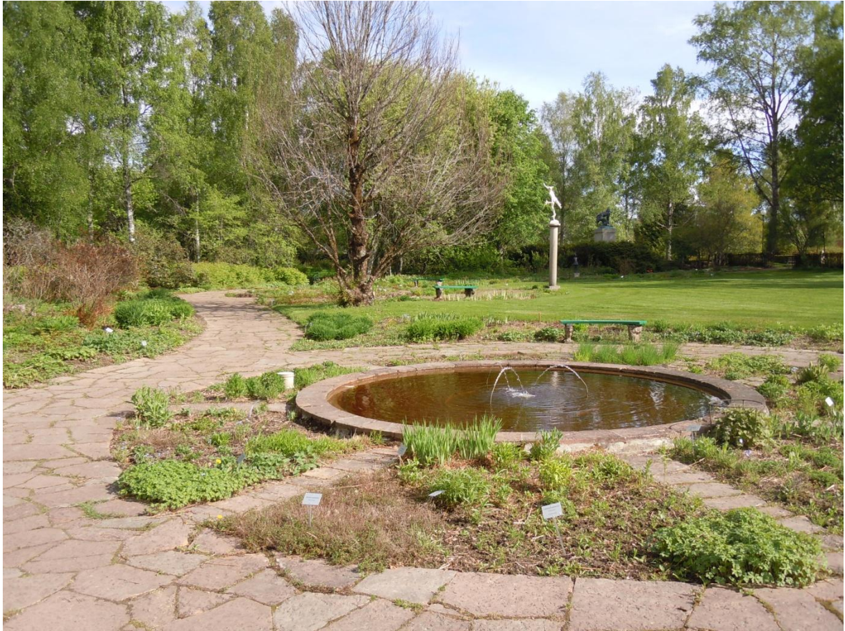
Vy över Blomstergården.

röd. I de formellare delarna består gångarna huvudsakligen av röd kalksten samt av ett finkornigare grus (Informant 1).