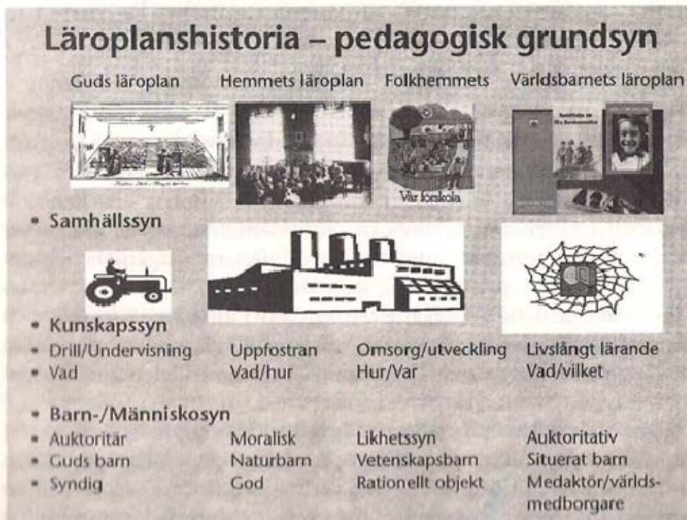
Figur 6.1 En begrepps- och symbolkarta över de yngre barnens läroplanshistoria – pedagogisk grundsyn.

Bild hämtad ur boken De yngre barnens läroplanshistoria, av Ann-Christine Vallberg Roth (2002)