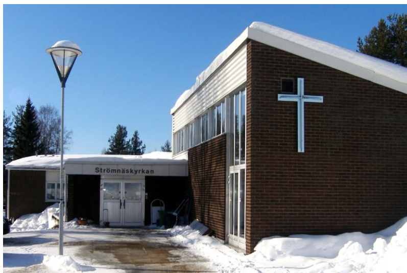
Bild 11, nedan: Strömnäskyrkan från framsidan. Varierande takfall och asymmetriskt placerade byggnadskroppar. Kyrksalen finns till höger i bild. Till vänster om entrén finns en klockstapel bredvid trappan ner till baksidan.