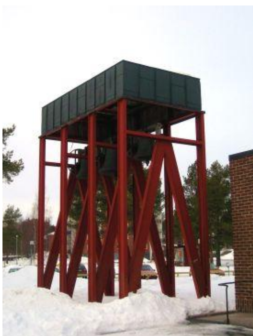
Bild 3. Örnäsens kyrkas klockstapel tillverkad av plåtbalkar.