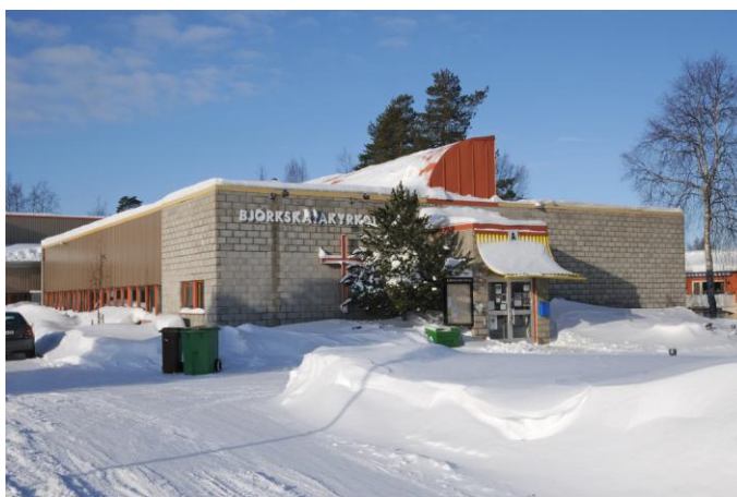
Bild 4, ovan. Björkskatakyrkan som i sin västra del sitter samman med centrumanläggningen. Kubisk byggnadskropp täckt av plåt och betongsten med framskjutet entréparti.