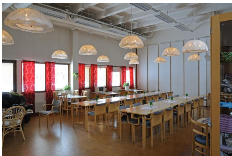
Bild 8, nedan: Serveringsdel där vikväggen i den bortre änden möjliggör för förändring av lokalutrymmen.