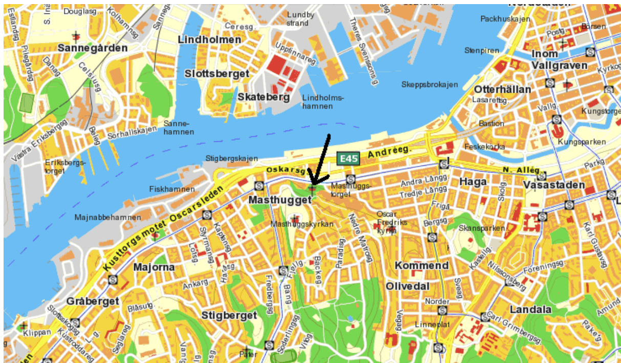
Bild 5. Karta visande var St. Johanneskyrkan är belägen.

Kyrkan uppfördes därför med öppna bänkkvarter utan numrering och man har aldrig kunnat hyra platser i St Johanneskyrkan.