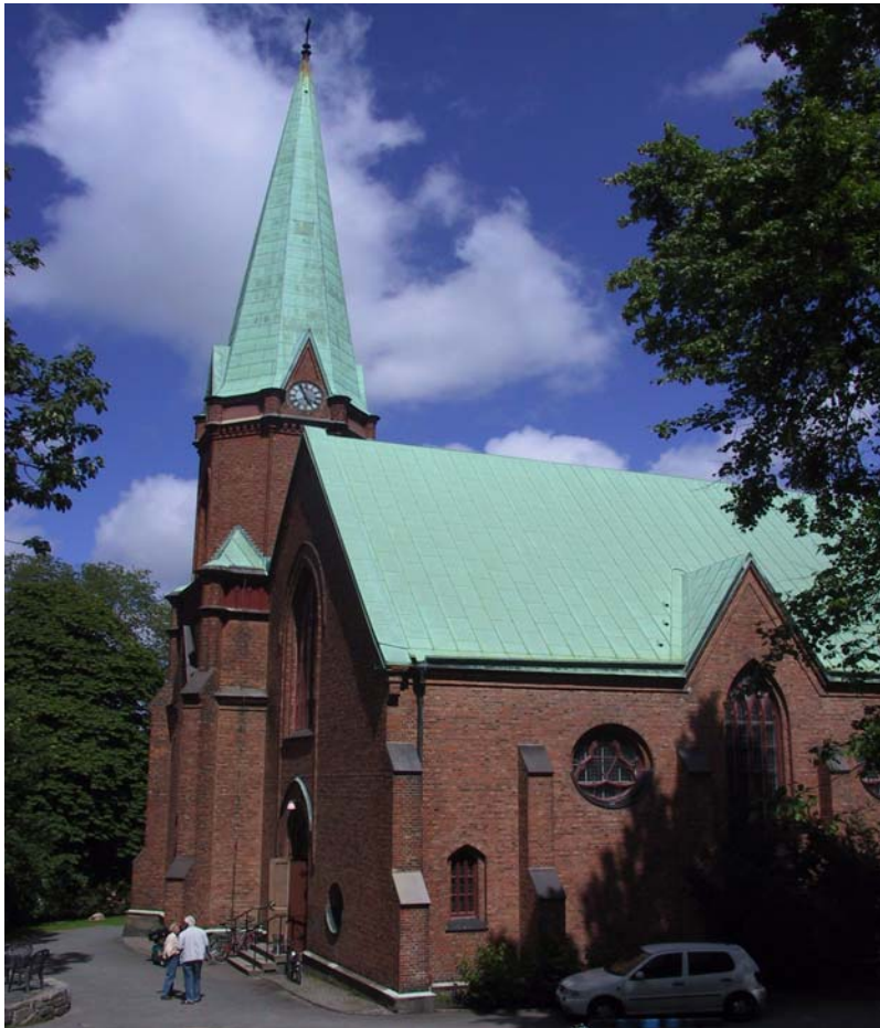
Bild 7. Exteriör St. Johanneskyrkan idag.

Kyrkan står utan specifikt lagskydd, men som alla andra kyrkobyggnader tillhörande Svenska kyrkan, och som är uppförda innan utgången av den 20:e december 1939, har den ett visst skydd. Den får inte ändras väsentligt utan tillstånd från Länsstyrelsen. Tillståndsplikten gäller även en del nyare kyrkor med höga kulturhistoriska värden.