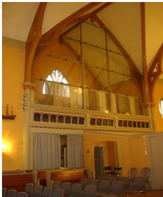
Bild 9. Och 10 . Sidoläktarna före och efter renovering.

Kyrkan har i och med den senaste restaureringen iordningställt två rum för olika självhjälpgrupper och håller där ca 30 möten i veckan. Lokalerna som är belägna på de två sidoläktarna, hyrs ut till bland annat AA, NA, GA, FAA, m.fl. Tillsammans med caféet som är en gemensam mötesplats, understödjer denna kreativitet och möjlighet till nya former av stöd och hjälp, det blir en grogrund för nyskapande. Tidningen Faktum samt KRIS startades här tack vare dessa möjligheter att mötas på ett öppet och avslappnat sätt, utan krav, förutfattade meningar och med stöd och hjälp från St Johanneskyrkan. Vid den senaste renoveringen sattes stora glasväggar upp i båda sidoläktarna så att man kan se ned till kyrkorummet, detta på initiativ av Stadsmissionens styrelse. Glaset med stålkonstruktion bryter starkt mot rådande arkitektur i byggnaden.