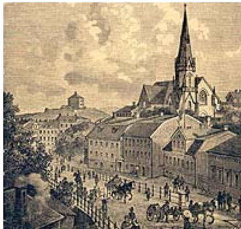
Bild 4. Historisk vy över St. Johanneskyrkan.