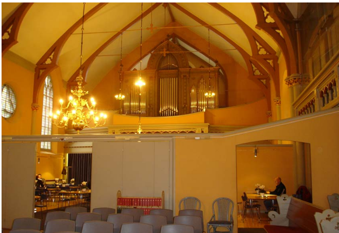
Bild 11 . Vy mot orgelläktare, västra sidan.

Den interiöra kulören togs fram genom färgprover i samarbete med Stadsmuseet. Även St Johanneskyrkan präglades av 1800-talets ofta färgstarka och variationsrika färgsättning och man ville återskapa den i dess ursprungliga kulör, men tyvärr blev det ett resultat utan den utsmyckning som en gång fanns där. De ekonomiska medlen räckte inte till för dekor, bemålade omfattningar och band, med mera. 41