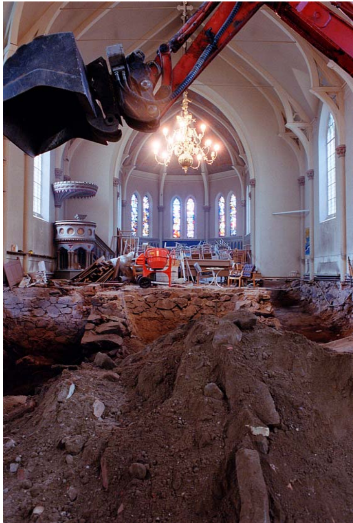
Bild 8. 2003 åtgärdas stora fuktskador i grundkonstruktionen genom ny dränering runt kyrkan, rivning av befintligt golv och bjälklag, grävning, isolering samt gjutning av nytt golv. Hussvampsanering genomförs. Väggar och snickerier ommålas, trägolv läggs in i kyrkan. Ombyggnad utifrån ny planlösning med nya toaletter och nya samtalsrum.

En karaktärisering utförs för att tydliggöra de specifika kulturhistoriska karaktärsdrag som i varje enskild kyrka och kyrkomiljö är särskilt viktigt att ta hänsyn till. I detta fall togs ingen hänsyn till dessa aspekter först efter flera år, i samband med den renovering som genomfördes 2003. Det är förståeligt att det kan bli på detta sätt då en privat organisation tar över en kyrka och vill anpassa