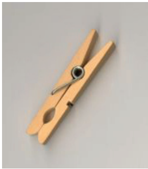
En klassisk klädnyppa.

Utställningsformen får bilderna sin slutgiltiga destination där bildgrammatiken knyts samman med en rumslig upplevelse. Denna rumsliga upplevelse statuerar eller realiterar förståelsen av innerbörden i den mentala konflikten i ytterligare ett fysiskt stadium mot åskådaren.