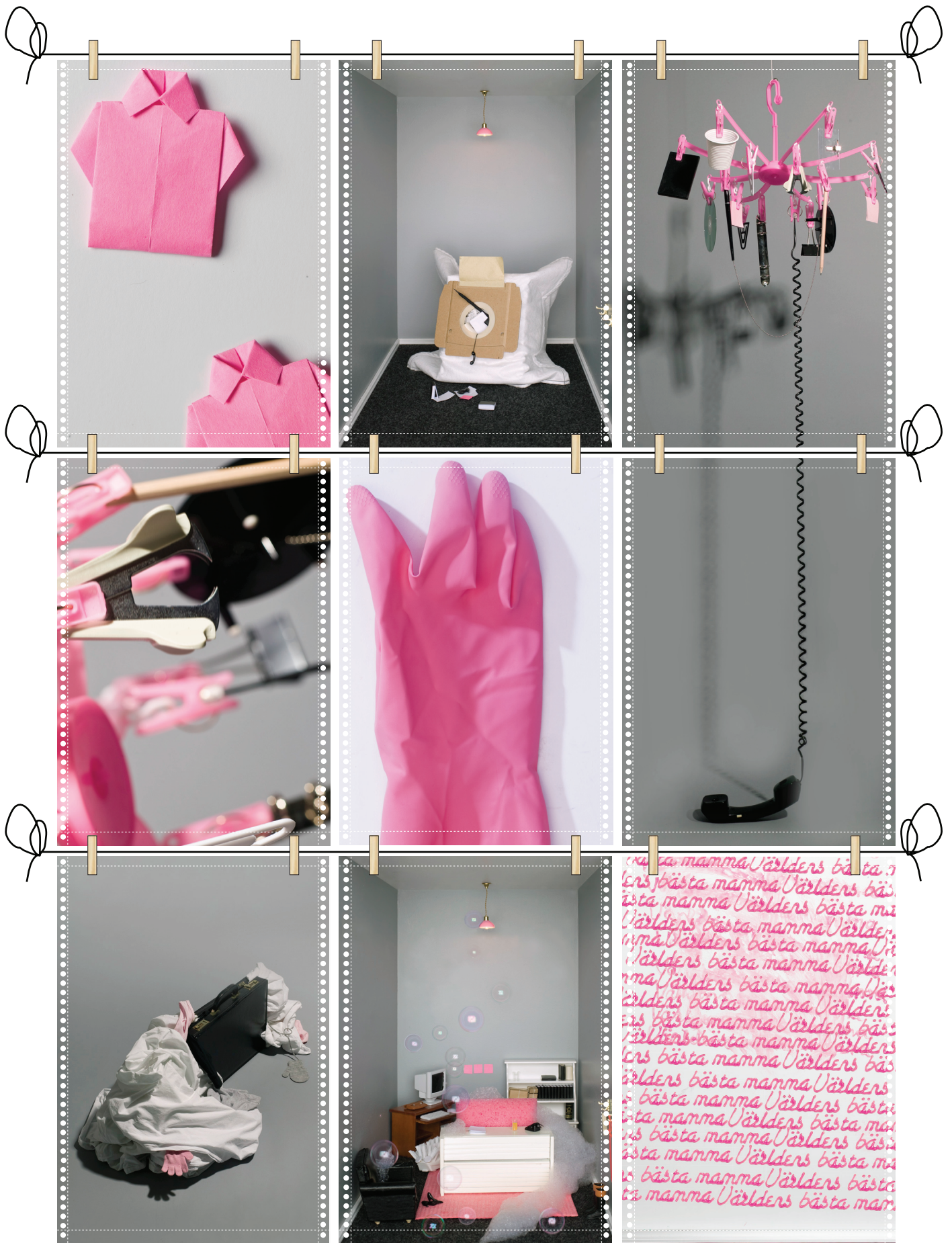
Här är ett förslag på hur bilderna kan hängas upp tillsammans för att skapa en större bildyta där bilderna förankras i varandra.