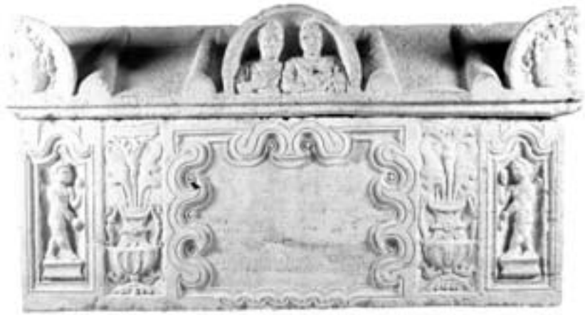
Bild 3. Ulpius Romanus sarkofag. (Visy, Z., "Historischer Überblick", i; Von Augustus bis Attila. Leben am ungarischen Donaulimes, Stuttgart 2000, 16.)

Båda männen var verksamma i den romerska armén. Sonen dog vid 35 års ålder. Detta innebär att fadern som överlevt sin son uppnått en relativt hög ålder. Om modern/hustrun får vi inte någon information från inskriften. Inte heller framgår det om den avlidne sonen hade några syskon. Då ingen hustru till sonen nämns är det möjligt att han inte var gift. Fadren som arbetade som dakisk tolk kan ha varit bördig från provinsen Dacien eller vid något tillfälle varit förlagd där.