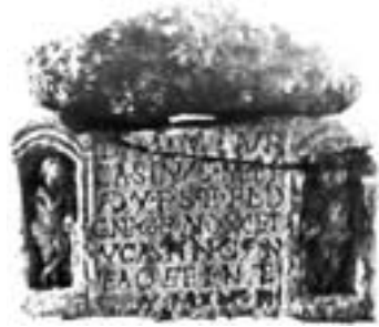
Bild 1. Skiss av den typiska noricum-pannoniska sarkofagen. (Skissen gjord av artikelförfattaren.)