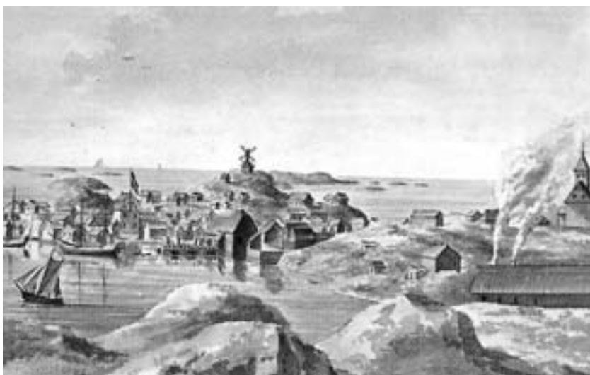
Utsikt mot Klädesholmens fiskeläge och hamn. Akvarell av Fredrik Weinberg 1794 (detalj)