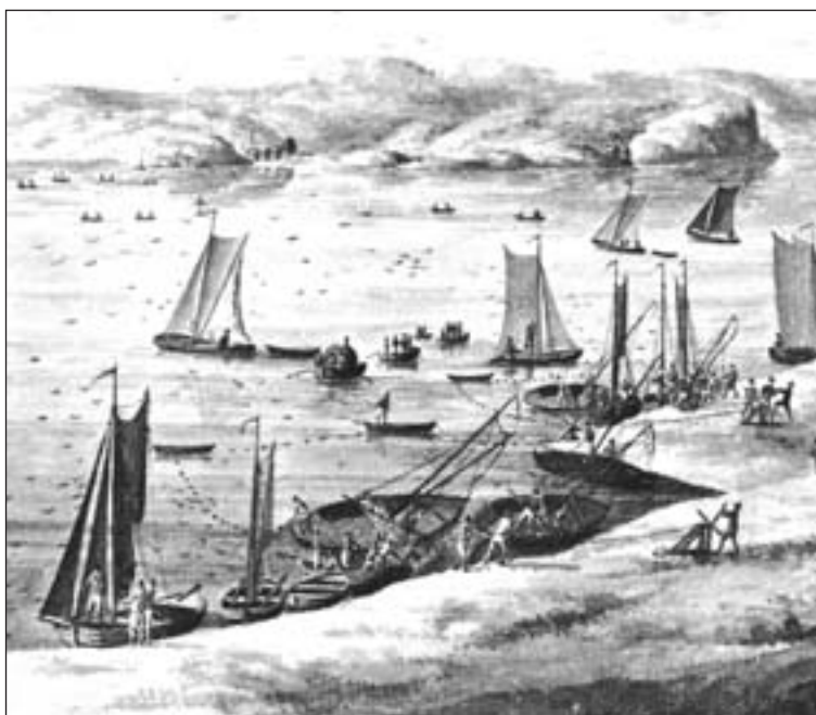
Sillfiske i skärgården innanför Marstrand. Akvarell av Fredrik Weinberg 1794 (detalj)

är anmärkningsvärt stor inte minst med tanke på Sveriges ringa folk- mängd. Man kan betrakta dem som ett exceptionellt och tidsbegränsat undantag. (I slutet av 1800-talet kom en ny sillperiod i Bohuslän, vilket också drog många vandringsarbetare, men omfattningen var då mindre än på 1700-talet.)