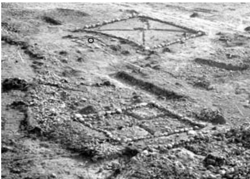
Figur 3: Mitt i bilden mellan den stora kvadratiska graven och stensträngen (stenmuren) syns den lilla graven med en nedstucken kniv. Graven med kniven är markerad. Kniven kan ha fungerat som en amulett som håller den döde på rätt sida om gränsen mellan dödsriket och de levandes land. Fotografi från mobilkran av Leif Häggström 2002.

I samband med en arkeologisk undersökning i Ekparken i stadsdelen Rosenlund i Jönköping undersöktes våren 2002 en gård från järnåldern. Huvudbyggnaden verkar ha byggts runt 200 e.Kr. och varit i bruk något hundratal år. Tydliga spår av var ingångarna varit placerade kunde identifieras. Mitt i den västra delen av huset fanns spår av en eldstad. I ett av de stolphål som burit upp takstolens centrala del gjordes ett märkligt fynd. I stolphålet hittades de svårt rostangripna resterna av en spjutspets.