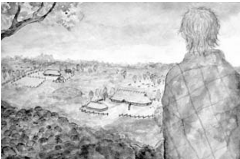
Figur 1: Två av gårdarna i Öggestorp som de kan ha sett ut 200 e.Kr. I bakgrunden till vänster i bilden skymtar stensträngen. Mellan gårdarna ligger ett gravröse i vilket en kvinna i 20–40 års åldern gravlades något årtionde före vår tideräkning tar sin början. Kvinnan lades på en bädd av vitmossa och kremerades innan gravmonumentet byggdes. Gravbålet byggdes upp av ved från träslagen al, ask, asp, björk, hassel, tall samt rönn eller oxel. Runt gravröset finns spår av att man odlat brödvete, emmer och skalkorn. Den högra gården inrymde såväl ett större bostadshus, som mycket väl kan ha haft en avdelning för kreaturen, som en smedja. Akvarell av Ragnhild Bronsek 2003

Sommaren 2002 undersöktes ett större område i Öggestorp, norra Småland. Till skillnad från många andra arkeologiska undersökningar som görs i Småland blev det denna gång mer än ett titthål. Totalt grävdes lite drygt 40 000 m 2 ut i samband med undersökningen. Det undersökta området var stort nog att täcka in två olika gårdar med tillhörande begravningsplatser och åkrar från tiden strax efter att vår tideräkning tagit sin början. Tillsammans med en arkeologisk undersökning som genomfördes ett par år tidigare finns nu tre identifierade, i stort sett samtida, gårdar inom synhåll från varandra. För en gångs skull finns möjligheten att diskutera gränsdragning på ett lokalt plan i Småland.