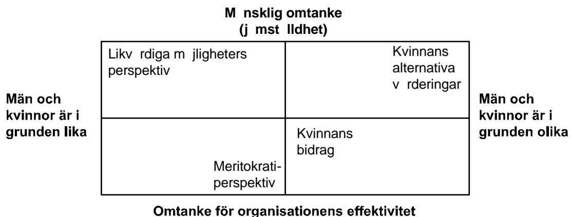
Figur 1, Fyrfältsdiagram över förhållanden mellan grundläggande synsätt av kvinnan i ledarskapsroll

I en artikel som publicerades 1989 i tidskriften Scandinavian Journal of Management av sociologerna Mats Alvesson och Yvonne Billing diskuteras det kring kvinnligt ledarskap. Författarna menar att det kan hittas olika utgångspunkter från vilka organisationer och individer agerar i frågan om kvinnor i ledande positioner. De fyra perspektiv Alvesson och Billing pekar på i artikeln är; (1) ett likvärdiga möjligheters perspektiv, (2) ett meritokratiperspektiv, (3) ett perspektiv som ser till vad specifikt kvinnan kan bidra till organisationen, (4) och ett sista perspektiv som uppmärksammar kvinnans alternativa värderingar. Nedan följer en kort genomgång av de fyra synsätten. För att vidare illustrera kontrasten i de olika perspektiven så ställer Alvesson och Billing upp ett dikotomt fyrfältsdiagram med synen på kön i X-led och omtanke för organisation/människa i Y-led.