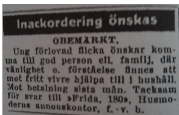
Fig. 1. Annons ur en veckotidning från 1923 55

Barn som blev födda utanför äktenskapet under tidigt 1900-tal hade nu större rättigheter jämfört med tidigare. Tidigare hade inte ett oäkta barn rätt att arva varken sin fader eller sin moder. Efter en lag som tillkom den 17 mars 1905 fick ett oäkta barn nu rätt att arva sin mor. 56 Även om det skedde förbättringar angående ett oäkta barns status hade barnen ändå stora svårigheter ute i samhället. I SCB:s Statistiska meddelanden går det att läsa påståenden som är ovanliga för nutidens läsare. SCB menade att eftersom det statistiskt sett föddes mest oäkta barn av fattiga föräldrar, ledde detta till att barnen inte kunde skilja på vad som var rätt och fel. 57 I ett utdrag från SCB, år 1914, kan man läsa att samhället ansåg att utomäktenskapliga födslar gjorde folk ointelligenta.